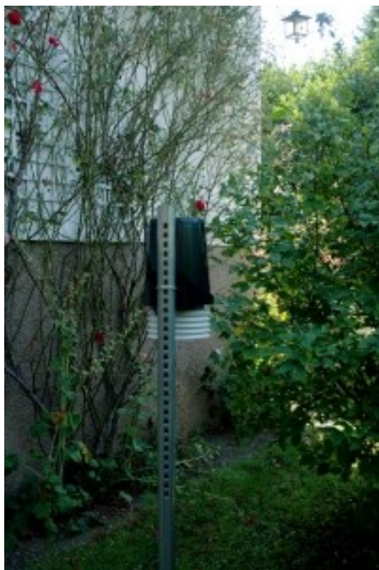
Le pluviomètre et les capteurs de température/humidité dans le jardin

L'équipe de CLI.M.A.57-67-68 vous remercie pour votre soutien. A bientôt !