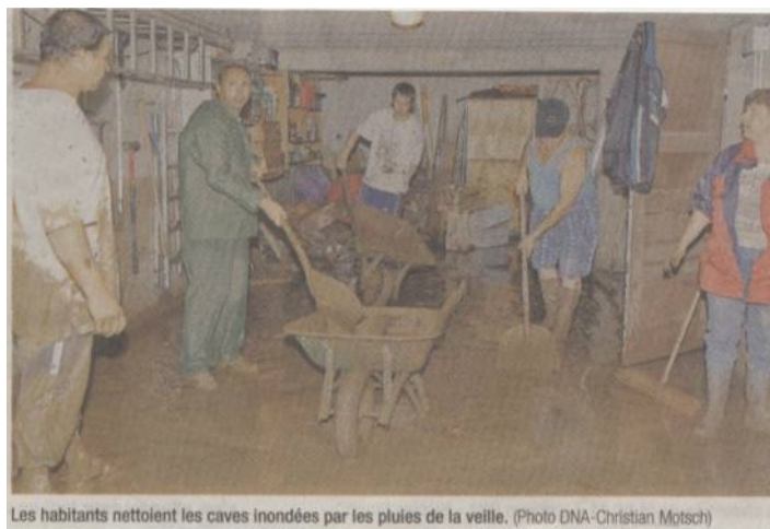
Les habitants nettoient les caves inondées par les pluies de la veille.

La plupart des plants et des arbres fruitiers ne résistent pas à de telles intempéries. Les serres s'effondrent, détruisant les géraniums et autres plantes de cette vallée fleurie. Les cultures de raisins de Bennwihr sont détruites à près de 90% et les dégâts des autres cultures s'élèvent entre 50 et 100%. Les cultivateurs ne comprennent pas, il y avait de cela une semaine, leurs plants bénéficiaient de soleil et de températures tout à fait estivales.